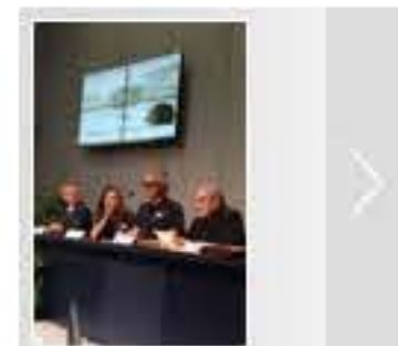
Cantare il Grande Mistero