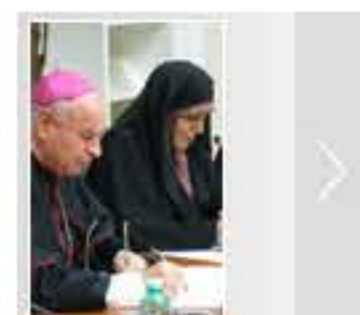
Donna e famiglia in Iran