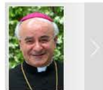
La "buona notizia" del Matrimonio