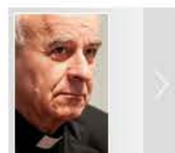
Perché i semi germogliano