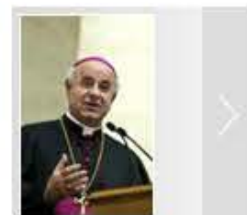
Una Chiesa ispirata alla famiglia