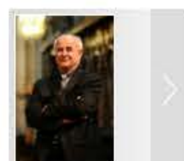
Tra penitenza e perdono